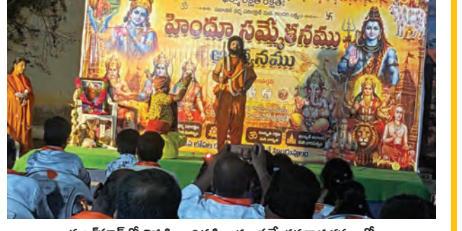
డబిల్ హార్డ్ నిర్వహించిన హిందూ సమ్మేళన కార్యక్రమంలో యువకులు నిర్వహిస్తున్న సాంస్కృతిక కార్యక్రమం

మేడ్చల్, మే 25, ప్రభాతవార్త: ఎల్లంపేట మున్సిపాలిటీలోని డబిల్ హార్డ్ గ్రామంలో హిందూ సమ్మేళన కార్యక్రమాన్ని ఘనంగా నిర్వహించారు. మున్సిపల్ పరిషత్ లోని గ్రామాల నాయకులు, ప్రజలు పాల్గొంటూ విచ్చేశారు. కాగా కార్యక్రమంలో ముందుగా యువకులతో కర్రసాము, మల్లయ్యల తదితర విన్నపాలు నిర్వహించారు. అనంతరం పలు సాంస్కృతిక కార్యక్రమాలు నిర్వహించారు. అనంతరం వక్రలు మాట్లాడుతూ భారత దేశంలో ఉన్న కుటుంబ వ్యవస్థ ప్రపంచంలో ఎక్కడా లేదని, హిందువు అంటే మతం కాదని, అది మానవ జీవన విధానం నేర్పించే పదమని అన్నారు. భారత దేశంలో పుట్టిన ఎన్నో జన్మలు పుణ్యపలమని, అందులో సమాజ హితం కోర్ హిందువుగా ఉండటం గొప్ప విషయమని అన్నారు. నేను ఇంకో మంచి చెడుల గురించి తల్లితండ్రులు చెప్పకపోవడంతో పిల్లలు పెద దారినిపడే అవకాశాలు అధికంగా ఉన్నాయని, ఇంటి నుంచే మంచి చెడుల గురించి చెప్పి రేపటి తరానికి పుణ్యం వేయాలని చెప్పారు. పర్యావరణాన్ని కాపాడే బాధ్యత అందరిపై ఉందని, చెట్లు నాటి వాటిని సంరక్షించాలని కోరారు. సమాజ హితంతో చెట్లను పెంచడమే కాకుండా వాతావరణ శుద్ధికోసం యజ్ఞహోమాలు జరిపాలని, ఆలోచ్య పరిరక్షణకు